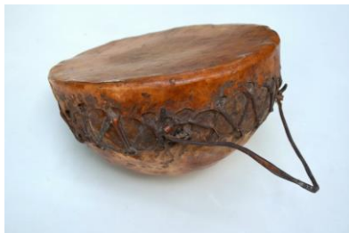
Foto. 12. Instrument muzical membranofon prevăzut cu o membrană din piele de animal; construcția corpului este realizată din ceramică (formă structurală emisferică) – tobă africană .