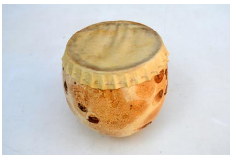
Foto. 18. Instrument muzical membranofon prevăzut cu o membrană din piele de animal; experiment constructiv realizat din coajă de dovleac sălbatic – tobă la care forma corpului său este similară cu formele tobelor din spațiul geografic african.

Foto. 17. Instrument muzical aerofon prevăzut cu un muștiuc circular primitiv (construit din lemn) specific trompetelor – model de trompetă dreaptă; experiment constructiv, la care, corpul (în întregul său) este realizat din coajă de dovleac sălbatic.