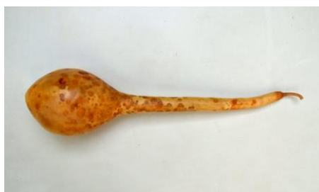
Foto. 8. Coajă uscată de dovleac sălbatic, la care, prin scuturarea semințelor sau a unor boabe de porumb introduse în interiorul său, sunt produse zgomote folosite în scop ritmico-muzical (fruct de dovleac neprelucrat); model construit biologic, întâlnit frecvent la unele instrumente muzicale idiofone.

Foto. 7. Fragment de coajă uscată de dovleac sălbatic la care, forma parțial ovoidă a corpului său a fost secționată transversal; model constructiv întâlnit frecvent la unele tipuri de instrumente muzicale membranofone.