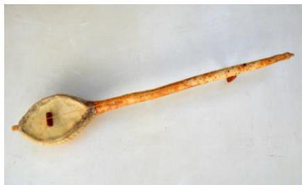
Foto. 15. Instrument muzical cordofon prevăzut cu o coardă; experiment constructiv, la care, corpul (în întregul său) este realizat din coajă uscată de dovleac sălbatic.

Randamentul acustic al instrumentelor construite din coji de dovleac sălbatic este foarte bun, în condițiile în care prelucrarea lor presupune un volum de muncă destul de redus (realizat fără utilaje de lucru specializate). În cazul acestor instrumente muzicale construite în mod simplist, singurul mare dezavantaj funcțional este legat de faptul că rezistența lor la diverse acțiuni fizice este foarte scăzută. Astfel de construcții muzicale nu pot fi utilizate pe perioade îndelungate de timp.