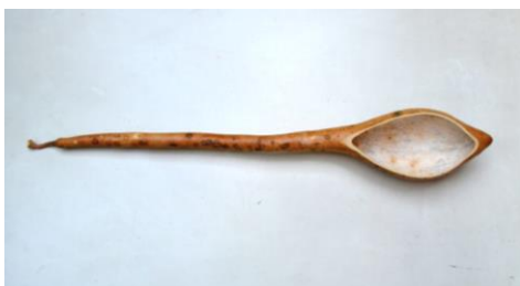
Foto. 5. Coajă uscată de dovleac sălbatic la care, forma parțial ovoidală a corpului său a fost secționată longitudinal; model constructiv întâlnit frecvent la vechile instrumente muzicale cordofone acționate prin ciupire sau prevăzute cu arcuș.

Aspectul fizic al dovleacului din specia Lagenaria Siceraria este oarecum atipic. În cazul său, prin prelucrările sumare ale fructului de dovleac (făcute prin secționări ale corpului său) pot fi obținute unele forme (structuri) constructive care seamănă mult sau chiar sunt identice cu modelele unor instrumente muzicale ancestrale prelucrate într-un mod rudimentar. De menționat este faptul că, aceste „tipare constructive” sunt întâlnite destul de frecvent la patru categorii / subcategorii muzical-instrumentale: cordofone (cu coardele ciupite sau frecate cu arcușul), aerofone (cu ancii sau cu ambușură circulară), membranofone (prevăzute doar cu o membrană) și idiofone (acționate prin scuturare).