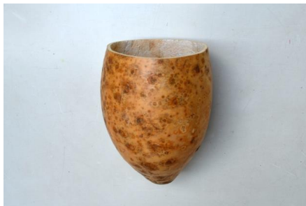
Foto. 7. Fragment de coajă uscată de dovleac sălbatic la care, forma parțial ovoidă a corpului său a fost secționată transversal; model constructiv întâlnit frecvent la unele tipuri de instrumente muzicale membranofone.