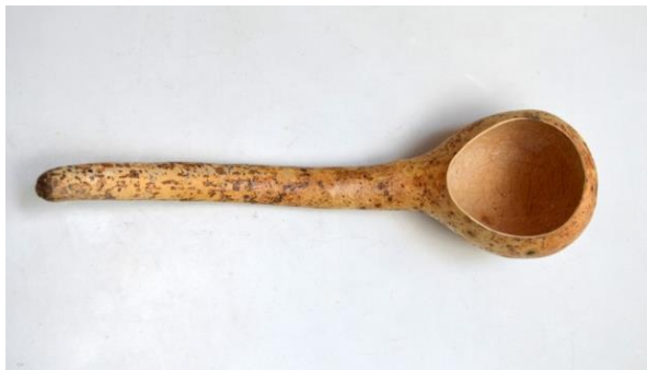
Foto. 3. Model de polonic (cauc), folosit în activitățile gospodărești din mediul rural.