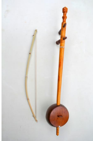
Foto. 10. Instrument muzical cordofon prevăzut cu două coarde acționate prin frecarea cu un arcuș primitiv; construcția este realizată din lemn și coajă de nucă de cocos – „Saw U”, Tailanda.