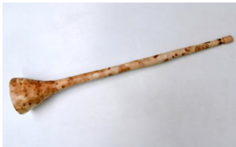
Foto. 17. Instrument muzical aerofon prevăzut cu un muștiuc circular primitiv (construit din lemn) specific trompetelor – model de trompetă dreaptă; experiment constructiv, la care, corpul (în întregul său) este realizat din coajă de dovleac sălbatic.