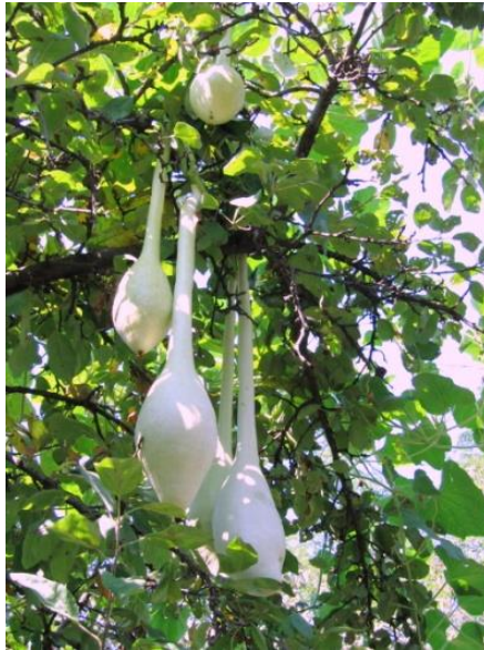
Foto 1. Dovleacul sălbatic – Lagenaria Siceraria , plantă a căror tulpini și fructe stau cățarate în pomi.

(coaja uscată a fructului de dovleac) preluată integral sau într-o manieră secționată a fost folosită în cadrul activităților casnice din mediul rural. În acest sens, fructul de dovleac prelucrat sub diferite forme a fost utilizat ca: polonic (cauc), pâlnie, vas de păstrat lichidele, obiect utilitar de extras lichidele din recipiente casnice etc. Alte soiuri ale acestei specii au fost cultivate în scop decorativ.