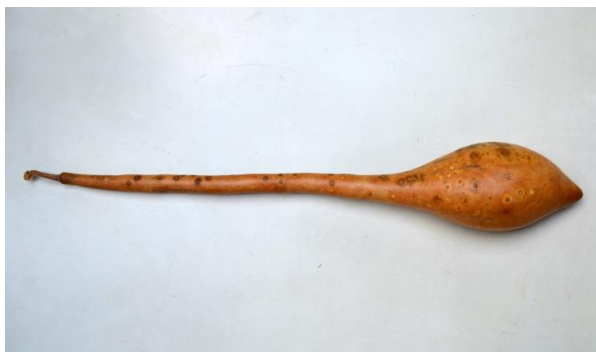
Foto 2. Fructul uscat al dovleacului sălbatic Lagenaria Siceraria .