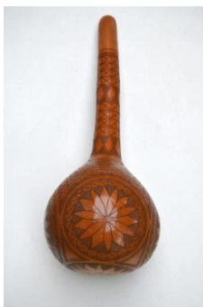
Foto. 14. Instrument muzical idiofon, prelucrat artistic dintr-o specie de dovleac sălbatic, la care, prin scuturarea semințelor din interior sunt obținute zgomote folosite în scop ritmico-muzical – instrument muzical idiofon african .