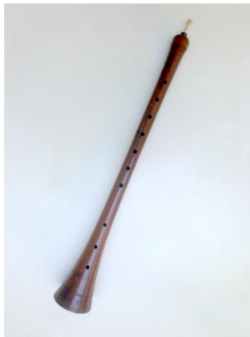
Foto. 11. Instrument muzical aerofon prevăzut cu ancie batantă dublă (construcția instrumentului din imagine este de dată mai recentă); instrumentul este realizat din lemn, prelucrarea sa fiind făcută la strung – „Surna” întâlnită la culturile tradiționale din Orientul Mijlociu (țările arabe, Turcia).