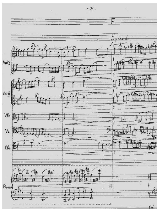
a) Concerthymne , fragment din secțiunea F pesante , în stare directă

Iată doar un exemplu de modificare a parametrilor sonori operată de către Liviu Dănceanu în variantele retrogradate ale secțiunilor, extras din secțiunea F, pesante .