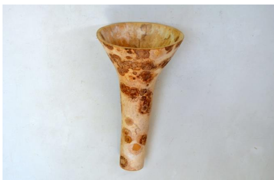
Foto. 4. Model de pâlnie, folosit în activitățile gospodărești din mediul rural.

Aceași coajă a fructului de dovleac poate fi folosită în mod deosebit de eficient și pe plan acustic pentru producerea unor sonorități (chiar dacă această formă de utilizare nu a fost sesizată (sau nu a rămas) în practica interpretativă din cadrul manifestărilor artistice specifice folclorului muzical.