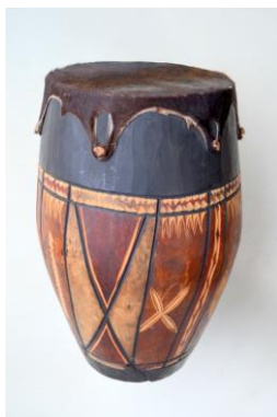
Foto. 13. Instrument muzical membranofon prevăzut cu o membrană din piele de animal; construcția este realizată din lemn, prin sculptură (formă structurală ovoidală) – tobă africană .