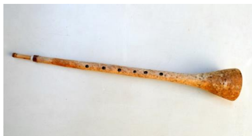
Foto. 16. Instrument muzical aerofon prevăzut cu un dispozitiv vibrator primitiv (carabă de cimpoi cu ancă simplă de trestie) – model de clarinet primitiv; experiment constructiv, la care, corpul (în întregul său) este realizat din coajă uscată de dovleac sălbatic.

Foto. 15. Instrument muzical cordofon prevăzut cu o coardă; experiment constructiv, la care, corpul (în întregul său) este realizat din coajă uscată de dovleac sălbatic.