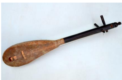
Foto. 9. Instrument muzical cordofon prevăzut cu două coarde acționate prin ciupire; construcția este realizată din lemn prin sculptură; membrana este prelucrată din piele de animal – Vechiul „Ud” întâlnit în culturile tradiționale arabe.

Dacă privim comparativ formele prelucrate sumar pe care le au cojile uscate ale fructelor de dovleac, în raport cu configurațiile constructive ale instrumentelor muzicale tradiționale întâlnite în cadrul unor culturi folclorice transmise pe cale vizual-orală, putem sesiza unele asemănări fizice frapante 1 .