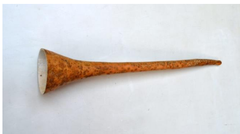
Foto. 6. Fragment de coajă uscată de dovleac sălbatic la care, forma parțial ovoidă a corpului său a fost secționată transversal; model constructiv întâlnit frecvent la unele instrumente muzicale aerofone primitive.

Foto. 5. Coajă uscată de dovleac sălbatic la care, forma parțial ovoidală a corpului său a fost secționată longitudinal; model constructiv întâlnit frecvent la vechile instrumente muzicale cordofone acționate prin ciupire sau prevăzute cu arcuș.