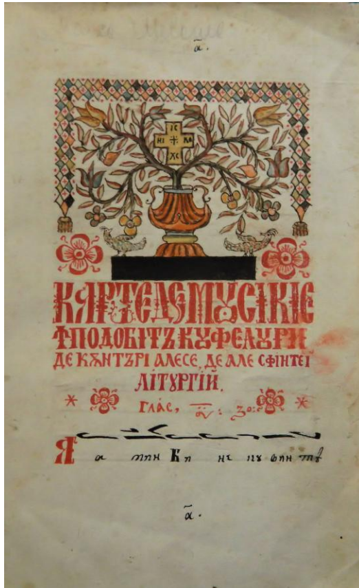
Foaia de titlu a Ms. rom.-gr. 3327

182-183 – Pre arătătorul... , glasul II în Di.