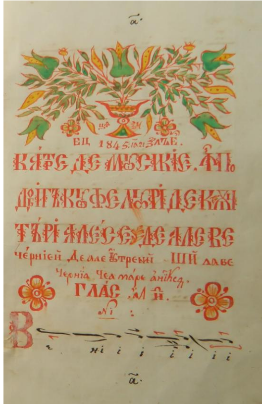
Foia de titlu a Ms. rom.-gr. 32