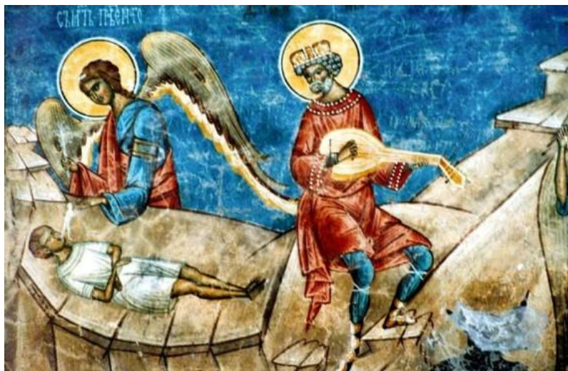
Regele David pe fresca de la Voroneț

Dintre toate cărțile Vechiului Testament , Cartea Psalmilor a fost și este cea mai citită pentru că ea este cartea în care se regăsesc oamenii așa cum sunt ei, în toate situațiile de viață și își pot identifica în ea propriile sentimente general valabile.