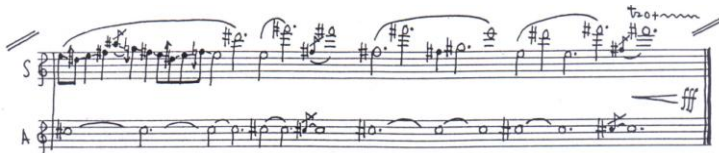
Ex. muz. nr. 9: citatul monteverdian

sunt atenuate de valorile lungi, fiecare element al melodiei fiind clar perceptibil.