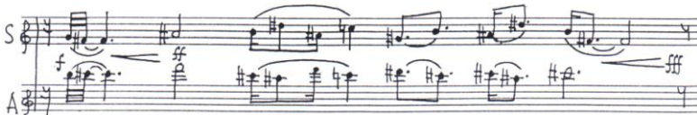
Ex. muz. nr. 8: încrucișarea vocilor

Izoritmia pasajului este dictată de posibilitățile tehnice ale impuse de bifonie, iar mișcarea aproape în oglindă a vocilor amintește de principiile polifoniei, la fel ca și încrucișarea vocilor. Se remarcă totodată unitatea tematică a secțiunilor piesei, asigurată prin reiterarea variată a celulelor ritmico-melodice (răsturnare, recurență – vezi celulele ritmice punctate din exemplul de mai jos și cele din ex. muz. nr. 2 ):