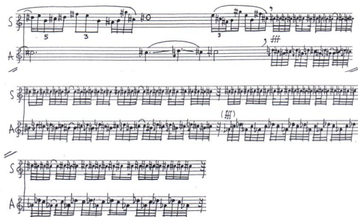
Ex. muz. nr. 6: organizarea sunetelor conform teoriei grafurilor

Nici imitația, procedeu specific polifoniei nu lipsește din desfășurarea Chant-son -ului. În finalul secțiunii, vocile sunt inversate: saxofonul sopran preia isonul ritmizat în timp ce saxofonul alto prefigurează același tip de linie melodică oscilantă, structurată conform teoriei grafurilor .