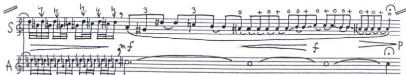
Ex. muz. nr. 5: opoziția stărilor densitate-rarefiere

compensatoriu, acalmia este prefigurată de cele intens melodizate, rarefiate.