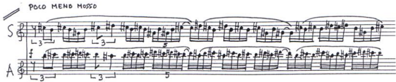
Ex. muz. nr. 7: debutul secțiunii B

excepționale ale valorii binare (pătrimea), înglobând în profilul lor două motive prezente la începutul piesei: cel preponderent ritmic, ostinat, și cel melodizat, introdus de triolet. Rezultatul îl constituie o suprapunere de două voci cu un profil sinuos aflate în relație de complementaritate.