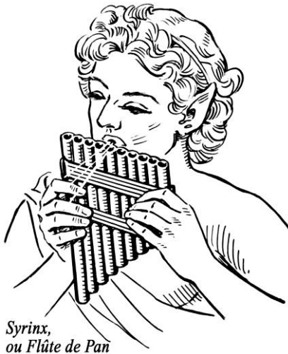
Syrinx, ou Flûte de Pan

musique le grand Apollon, maître de la lyre et dieu des arts, de la musique, du chant et de la beauté masculine.