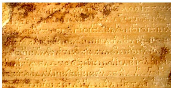
Le 1 er Hymne Delphique à Apollon (fragment) – gravure en marbre, cca. 138 av. J. C., retrouvé sur le mur de l'édifice Trésor des Athéniens, Delphes.

Dans l'image nous avons un exemple de notation musicale à l'aide des lettres de l'alphabet grec. C'est une inscription gravé en