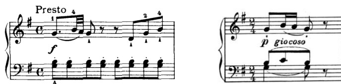
Ex. 6: (stânga) Joseph Haydn, Sonata pentru pian în sol major Hob XVI:40, partea a II-a, măs. 1, ed. Carl Adolf Martienssen, Edition Peters, Leipzig, 1937 (dreapta) Dinu Lipatti, Concertino în stil clasic pentru pian și orchestră de cameră , op. 3, partea a IV-a, măs. 1

Influențele baroce sunt lăsate în urmă în partea a patra , Allegro molto , unde arhitectura formei de sonată și citatul motivului muzical din prima măsură – capul tematic preluat din Presto-ul Sonatei pentru pian în sol major Hob XVI:40 de Joseph Haydn 1 (ex. 6) – ne trimit în sfera stilistică a Clasicismului. Mișcarea începe cu o dublă expoziție în tonalitatea sol major , prima expunere a temei fiind dedicată exclusiv instrumentului solist într-o scriitură briliantă. Orchestra preia apoi tema într-o formulă sprintenă, dansantă și vioaie, de folclor naiv (sugerat de notele repetate urmate de tril) –, amintind de o altă referință haydniană, finalul Concertului pentru pian în re major Hob XVIII:11.