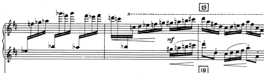
Ex. 9: Dinu Lipatti, Concertino în stil clasic pentru pian și orchestră de cameră , op. 3, partea a III-a, măs. 23-25

de articulație ( legato versus non legato ). Cea care face din Allegretto o bijuterie brillantă – și care beneficiază, totodată, de susținerea unei orchestre de prim rang, dar și de o înregistrare profesionistă – este Luiza Borac: curgerea infinită a notelor din Scherzo capătă, în versiunea pianistei, o asemenea delicatețe și strălucire, încât este imposibil să nu rămâi impresionat de tehnica impecabilă pe care aceasta o etalează. O nuanță interpretativă, de această dată născocită de dirijorul Gert Meditz, care nu își găsește justificarea în discursul anti-romantic al părții a treia, este liniștirea discursului muzical în ultima măsură a Trio -ului, ca o pregătire prin ritenuto a revenirii Scherzo -ului, întrerupând astfel fluxul acordurilor staccato încredințate instrumentelor de suflat din lemn.