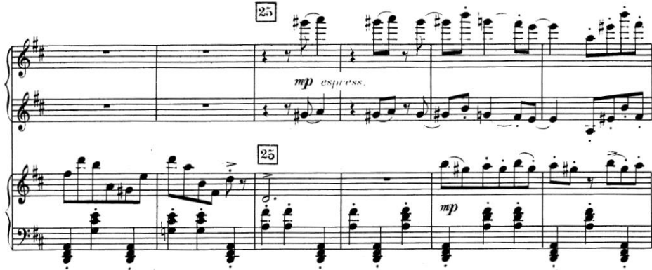
Ex. 5: Dinu Lipatti, Concertino în stil clasic pentru pian și orchestră de cameră , op. 3, partea a III-a, măș. 61-66

ritmică distinctă de marș și ragtime , creând un „melanj conceput în manieră swing , determinant, impozant” 1 (ex. 5).