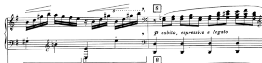
Ex. 2: Dinu Lipatti, Concertino în stil clasic pentru pian și orchestră de cameră , op. 3, partea I, măs. 51-52

Primul și singurul moment de dinamizare și amplificare a discursului muzical se face simțit la reperul 7, într-un caracter dezvoltător, redat printr-un alt tip de configurare a scriiturii pianistice – șaisprezecimi într-un suflu romantic –, pregătind revenirea secțiunii A. Înainte de instalarea tonalității dominantei (reper 8 – re major , pedală pe re ), se remarcă pauza generală marcată de compozitor, ce delimitează scriitura de șaisprezecimi de cea a trioletelor de optimi. Aceasta creează un moment de tensiune apropiat de spiritul baroc, sugerat prin figura retorică aposiopesis , definit ca o propoziție frântă în mod deliberat, lăsată neterminată, cu scopul de a sublinia dramatismul și de a reda sentimentul de suspendare; pauză generală, tăcere (descrierea morții, suspinul, durerea profundă, teama, sentimentul de evlavie – ex. 2).