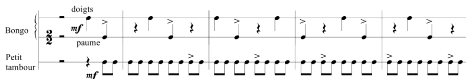
Ex. 13. Oresteia (1966), pentru cor și ansamblu instrumental, m. 219-223.

Continuând comparația, vom observa că mici celule ritmice suprapuse pulsației principale (isonului toacei), de genul celor adăugate de Toduță la tom-tom-uri, apar frecvent și în compozițiile lui Xenakis. Ca și în cazul accelerando -ului, ele sunt însă reduse la scheme abstracte generând cel mai adesea poliritmii repetitive foarte simple precum cea din Ex. 13.